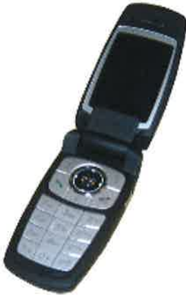
Fartelefon 3099 kr