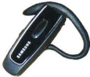
Bluetooth Headset Wep 150 825 kr