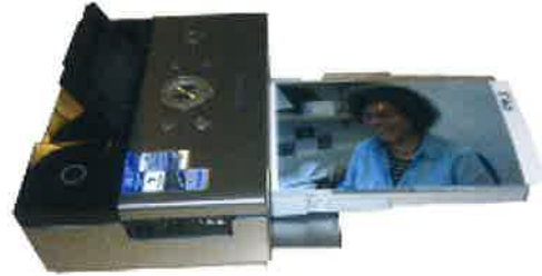
Prentari 1179 kr

Drós keypti sér eina fartelefon og ymiskt annað, ið hoyrir eini fartelefon til. Hon keypti fartelefon, Bluetooth Headset Wep 150 og ein trúðleysan prentara til fartelefonina.